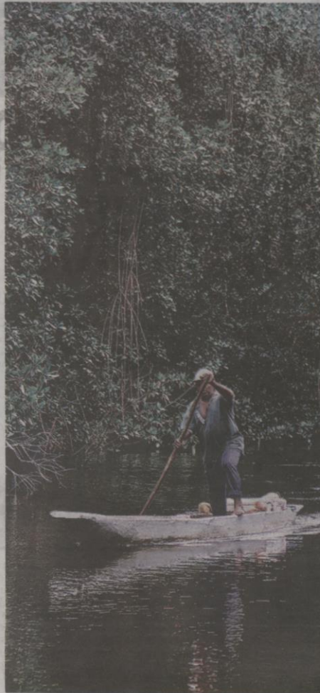
INISIATIF mesra alam bertujuan memberikan peralihan segmen perniagaan yang lebih mesra hijau.

Apple juga menambah 10 projek baharu untuk