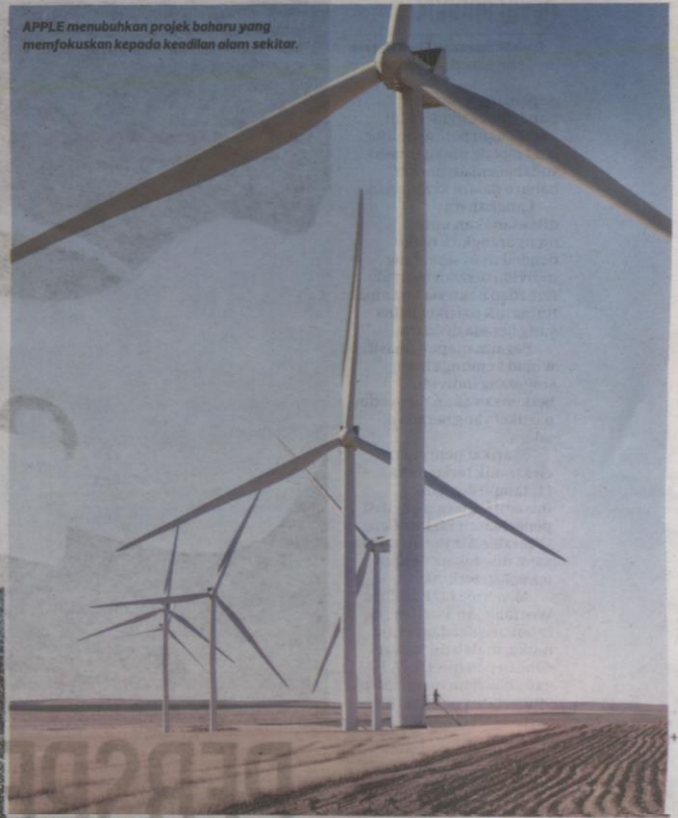
APPLE menubuhkan projek baharu yang memfokuskan kepada keadilan alam sekitar.

Kami bertindak dengan segera dan kami bertindak bersama-sama, tetapi masa bukan sumber yang boleh diperbaharui dan kita mesti bertindak cepat untuk melabur dalam masa depan yang lebih hijau dan saksama