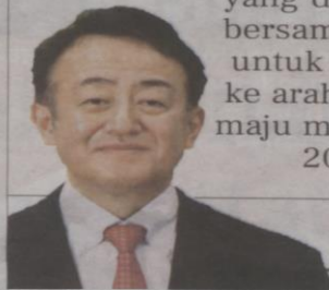
Katsuhiko Takahashi, Duta Jepun ke Malaysia

"Saya mengucapkan tahniah kepada Malaysia atas pencapaian ini, yang dijayakan bersama rakyat untuk menuju ke arah negara maju menjelang 2025"