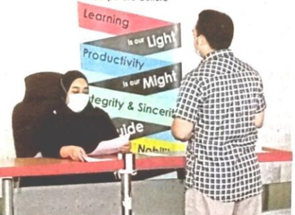
AKPK menyediakan modul mata pelajaran Pengurusan Kewangan Peribadi yang dijadikan subjek elektif di institusi pendidikan tinggi. (Foto hiasan)