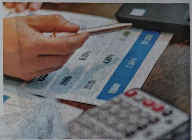
TAWARAN pinjaman yang menarik akan mendorong pengguna khususnya tanpa banyak dokumen yang diperlukan.

pakej akan memberikan tekanan kewangan kepada pengguna pada tempoh yang agak lama," katanya.