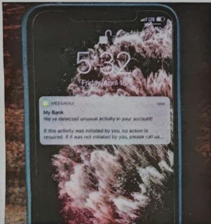
KEWUJUDAN bank digital beri kemudahan kepada pengguna, tetapi ia juga datang dengan risiko