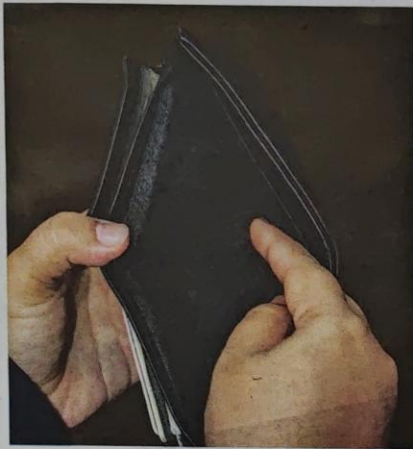
PENGGUNA perlu cakna tentang ilmu kewangan supaya tidak terbeban dengan hutang.

"Pengguna perlu peka terhadap pakej kewangan yang ditawarkan kerana jika dihitng secara kumulatif, sesetengah